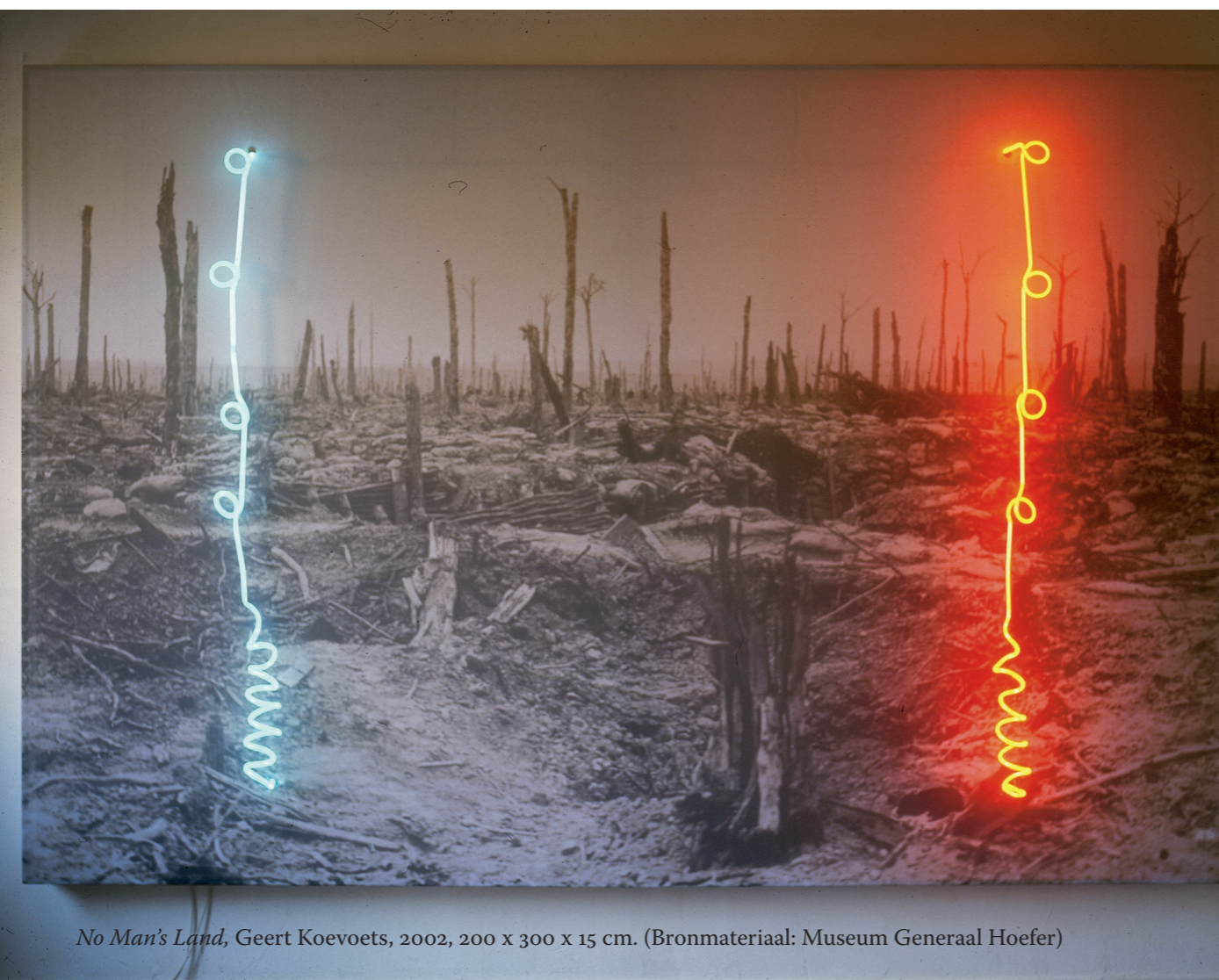
No Man's Land , Geert Koevoets, 2002, 200 x 300 x 15 cm. (Bronmateriaal: Museum Generaal Hoefer)