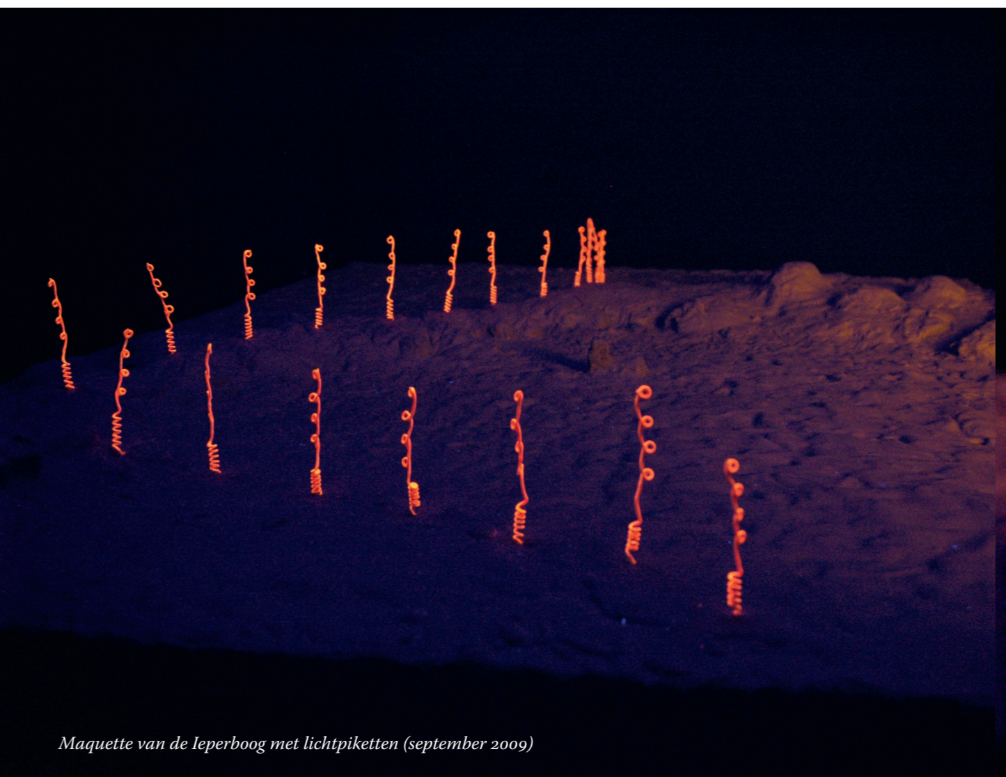
Maquette van de Ieperboog met lichtpiketten (september 2009)